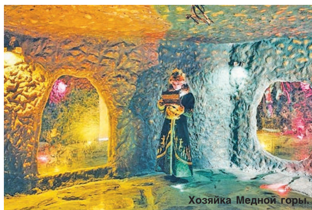
Хозяйка Медной горы.