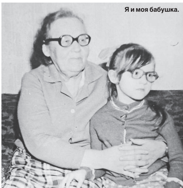
Я и моя бабушка.