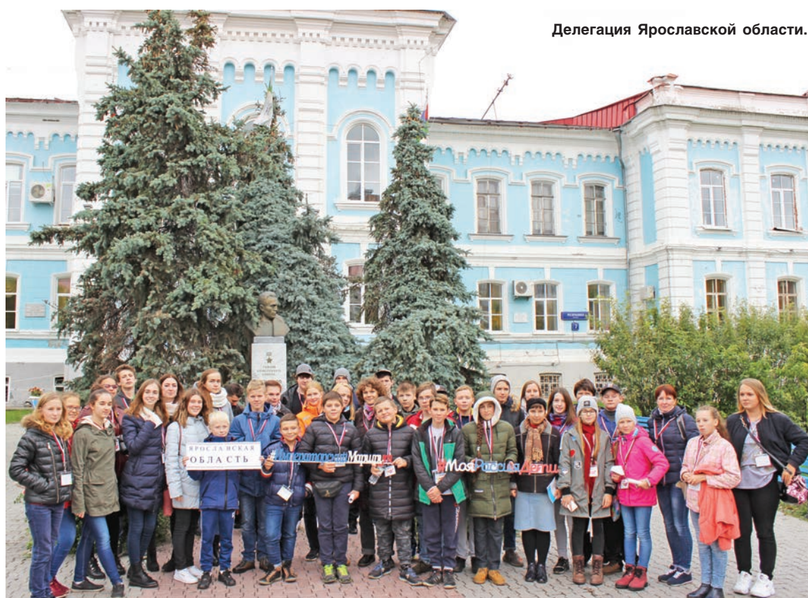
Делегация Ярославской области.