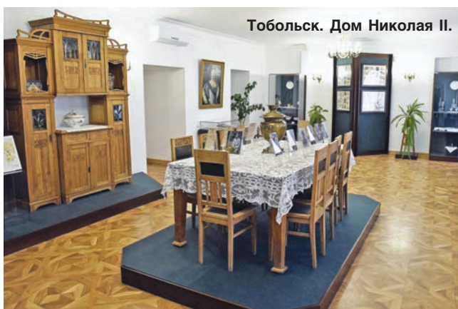
Тобольск. Дом Николая II.